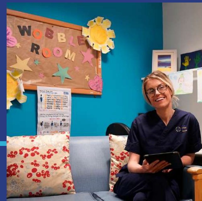
Tabledi electroneg a dyfeisiau digidol ar gyfer staff a chleifion