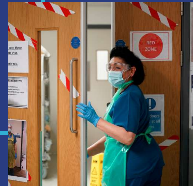
Cefnogaeth rithiol ar gyfer poen cronig