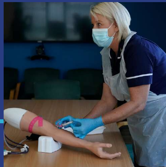
Offer i helpu staff i baratoi ar gyfer adleoli